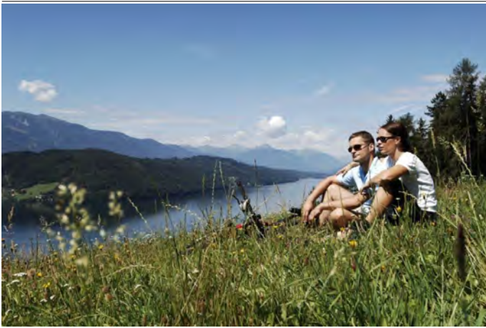
Radfahrer am Millstätter See