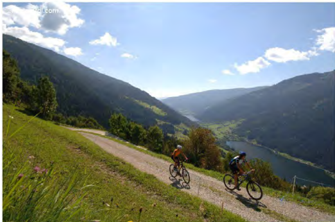
Aussicht Millstätter See